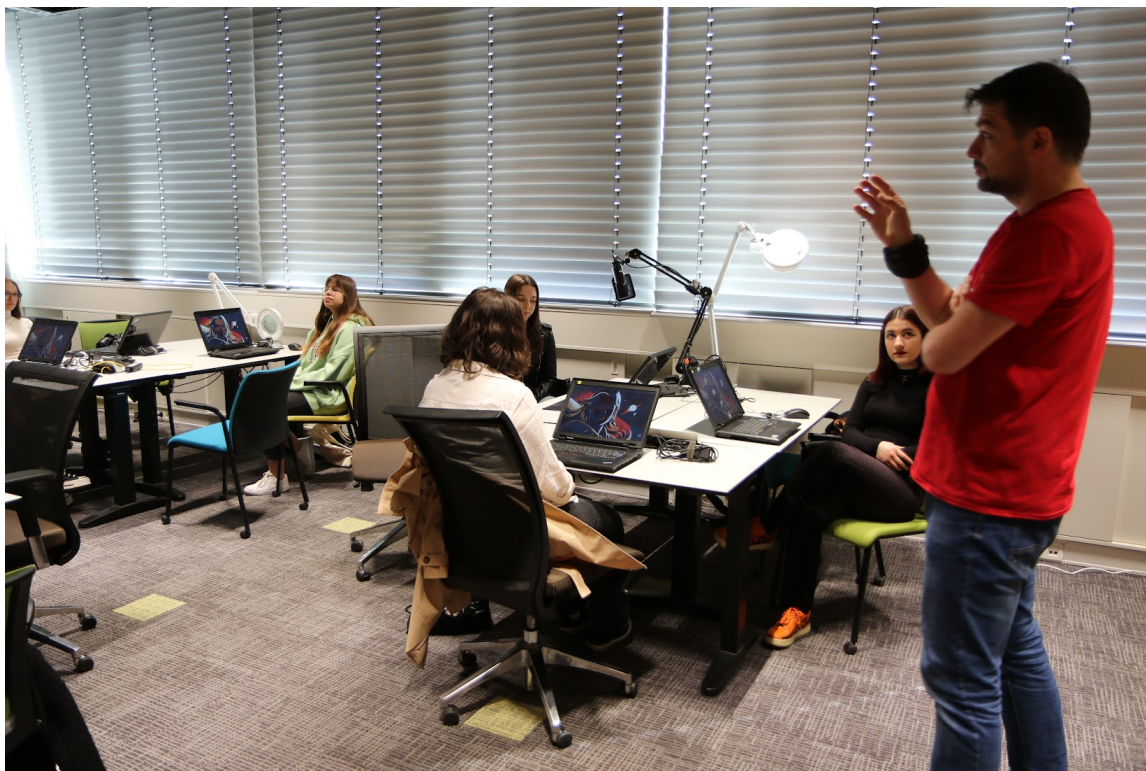
Girls Day 2023 v CNL