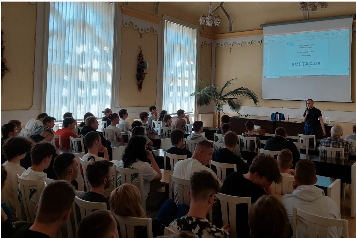
Moderné prístupy k PC sieťam: Programovateľnosť, monitorovanie a bezpečnosť